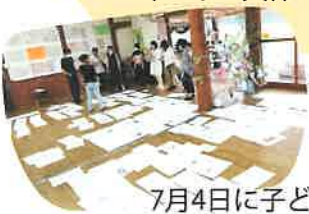
デザインの候補を絞っています

2020年度地球組12人は、日々の生活の中で認め合い、育ち合っています。その子どもたちの心が動いた成長の瞬間を、多くの方と共有し、共同保育のよさを広めていくために共保Tシャツを販売しています。