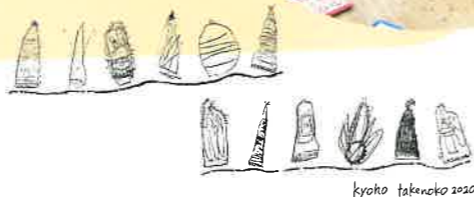
Kyoho fakeneko 2020

7月4日に子どもたちが描いた『もも、びわ、れんげ、チューリップ、あじさい、たけのこ、葉うちわ、果樹園の看板、田植え、こいのぼりパーティーのランチョンマット』を地球・月の部屋一面に広げ、先生から子どもの様子を聴きながらじっくり見て歩きました。「たくさんの観察画を描いているので季節を追って載せたい」「大人は固定概念があるけど子どもだから感じることでできるチューリップの絵がいい」などの声があがります。そんな中、候補としてあがっているのは『たけのこ』『果樹園』の絵。